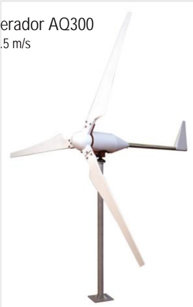
Aerogenerador AQ300 300W at 10.5 m/s